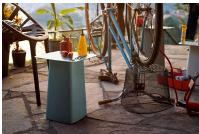
Metal Side Table (Outdoor)

De bijzettafeltjes zijn perfect te combineren met de Waverfauteuil voor binnen en buiten, waarvan het onderstel in dezelfde kleuren verkrijgbaar is.